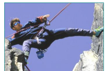
Zahn-Implantate bieten Sicherheit, festen Halt, Ästhetik und hohen Tragekomfort.

Zahn-Implantate bieten Ihnen einen festen Sitz, höchsten Kaukomfort und eine beeindruckende Ästhetik. Implantatgetragener Zahnersatz ist eine hochwertige Komfortversorgung, die gesetzliche Krankenkassen zum Teil bezuschussen.