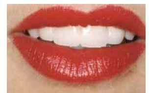
Nahezu alles ist möglich: vom Einzelzahn-Implantat bis zur implantatgetragenen Prothese.

Unverträglichkeiten oder Implantatverluste kommen statistisch betrachtet sehr selten vor. Implantate sind meist aus Titan, einem sehr körperverträglichen Metall.