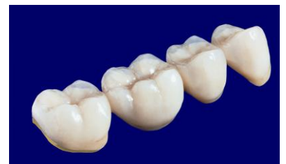
Seitenzahnbrücke mit zahnfarbener Keramik