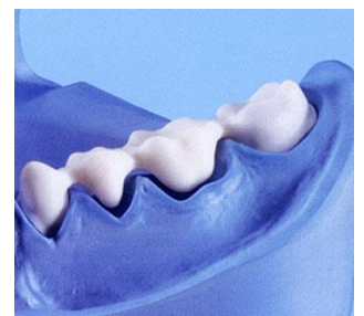
Vollkeramikseitenzahnbrücke unverblendet geätzt aus Zirkonoxid

Keramik-Brücken im Front- und Seitenzahnggebiet sind eine bewährte, sehr ästhetische und körperverträgliche Lösung . Die Vollkeramik -Brücke wird in Form und Farbe den natürlichen Zähnen nachgebildet.